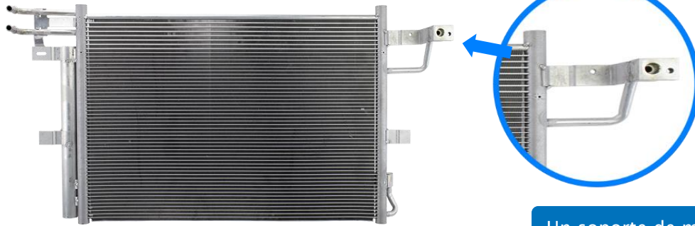
3911C – Condensador con COT; con secador