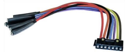
1711755 Cableado de la resistencia del motor del soplador

The 1711755 is a replacement blower motor resistor pigtail that comes with the same color coding as the wiring harness and includes heat shrink over the butt connectors. All you need to do is cut the old pigtail connector out, match the wire colors together, then crimp the lines. Finally, using a heat source, heat the heat shrink connectors to waterproof them.