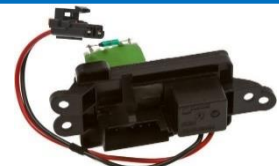
1711735 1999–2006 Cadillac Escalade Resistencia del motor del soplador sin consola central; montaje de 2 agujeros