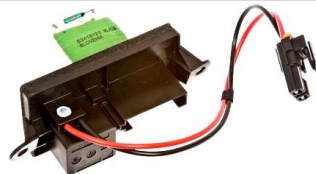
1711711 2003–2006 Cadillac Escalade Resistencia del motor del soplador con consola central