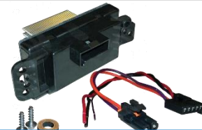
1711975 1999–2006 Cadillac Escalade Resistencia del motor del soplador con A/C automático y cableado