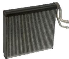
5811368 Bomba de vacío

Debido a que el vehículo no viene equipado con un filtro de aire del habitáculo, los residuos son arrastrados a la unidad del evaporador y se depositan dentro y alrededor del mismo (Figura 1.2). Los residuos depositados pueden aislar la sonda del termistor, creando lecturas de temperatura inexactas (Figura 1.3). Debido a que este evaporador es un diseño de estilo zonal, el termistor no puede ni debe ser movido. Mover el termistor dificultaría el rendimiento del aire acondicionado.