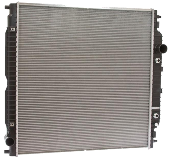
2887C – Radiateur Raccord rapide pour refroidisseur d'huile de transmission

gpd recommande l'utilisation d'un outil de déconnexion rapide des conduites de transmission lors de la déconnexion des conduites de transmission sur un radiateur équipé de raccords rapides.