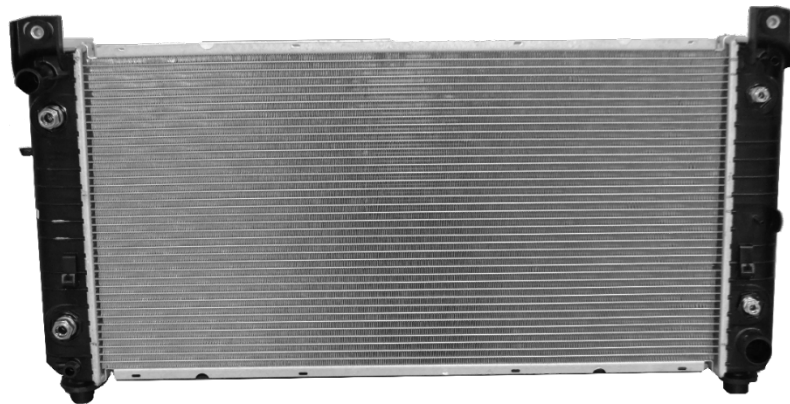
2370C – Radiateur avec TOC ; avec EOC

Les noms, logos et numéros de pièces des fabricants ne sont donnés qu'à titre indicatif. Tous les prix, taxes et disponibilités sont susceptibles d'être modifiés sans préavis. Ce document et tous les fichiers transmis avec lui sont confidentiels et destinés uniquement à l'usage de la personne ou de l'entité à laquelle ils sont adressés. Si vous avez reçu ce document par erreur, veuillez le supprimer immédiatement. Notez que tous les points de vue ou opinions présentés dans ce document sont uniquement ceux de l'auteur. Toute révision, utilisation, divulgation ou distribution non autorisée est interdite. Global Parts Distributors, LLC (gpd) n'accepte aucune responsabilité pour tout dommage causé par tout virus ou autre moyen transmis par ce document. © Global Parts Distributors, LLC (gpd)