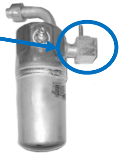
1411734 – Primer diseño Con aire acondicionado trasero