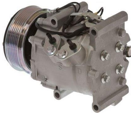
6511562 – Conexiones de manguera lado a lado