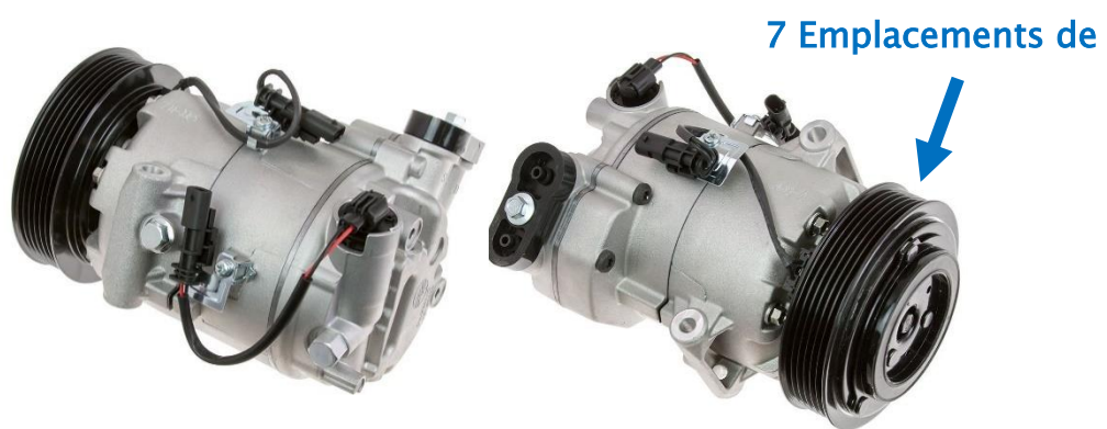
6512820 (Modèle Eco)

- Le compresseur gpd 6512820 convient au modèle Chevrolet Cruze Eco 2011 de 1,4 L. En plus des améliorations apportées au moteur et des modifications apportées à la conception du débit d'air à l'avant pour améliorer l'économie de carburant, le modèle Eco est également doté d'un compresseur à entraînement variable à commande électronique avec embrayage qui s'allume/s'éteint par rapport à la version à entraînement constant du modèle standard.